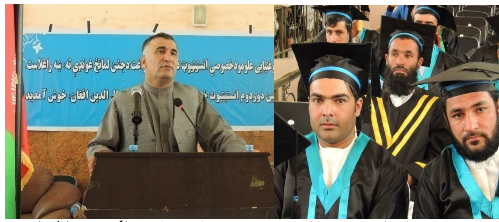
چې د خپل روغتیایي مسلک پرمخ وړلو کې له پوره وړانښت او ویجاړیو کې لاس لري، غږ وکړ؛ چې د